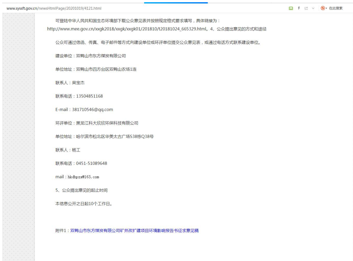
图2 第二次公告截图